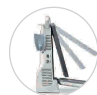
60 Grad Neigungswinkel