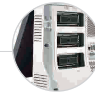
Max 3 Schallkopfanschlüsse