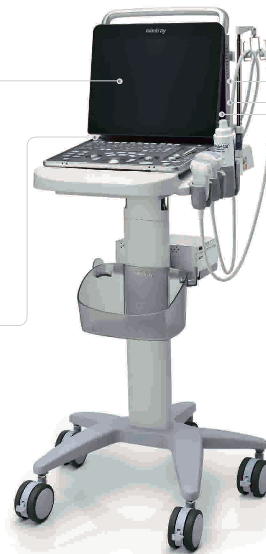
1.5h Scannen mit wiederaufladbarem Akku