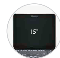
15 Zoll Vollbild-Design

Das integrierte Design mit internem Adapter und Akku macht das Z60 Expert mobil und jederzeit und überall verfügbar. In Kombination mit 3 Schallkopfanschlüssen erfüllt das Z60 Expert alle Ihre klinischen Anforderungen.